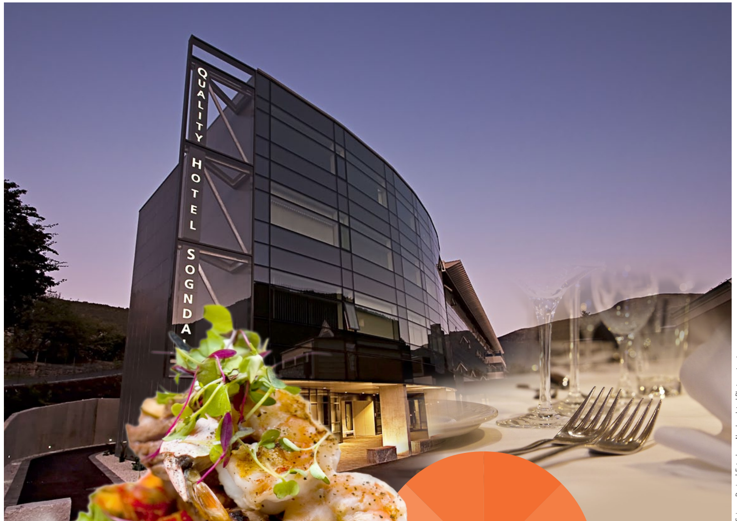
Sviggam Design